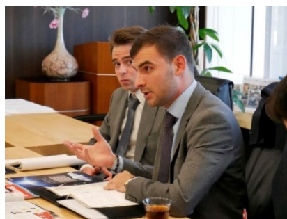
The Worldfolio 取材者