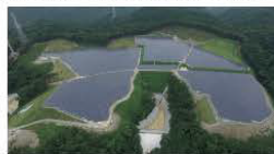
The Solar Panel Project Managed by JESCO

Strategic acquisitions have also played a vital role in securing high-quality human resources and skills in this field.